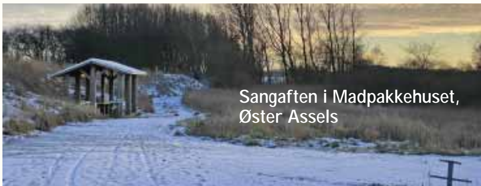
Sangaften i Madpakkehuset, Øster Assels

Torsdag den 30. maj kl. 19 byder vi op til sang, bobler og hygge i Madpakkehuset – se kortet.