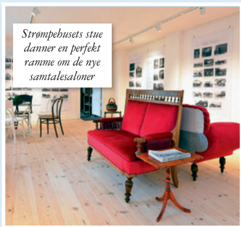
Strømpebusets stue danner en perfekt ramme om de nye samtalsaloner

Der er masser af ord i verden. Derfor bliver det endnu vigtigere at holde sig til dem, der gør en forskel – de ord, der flytter dine tanker og giver dig en oplevelse af at være sammen med mennesker i verden.