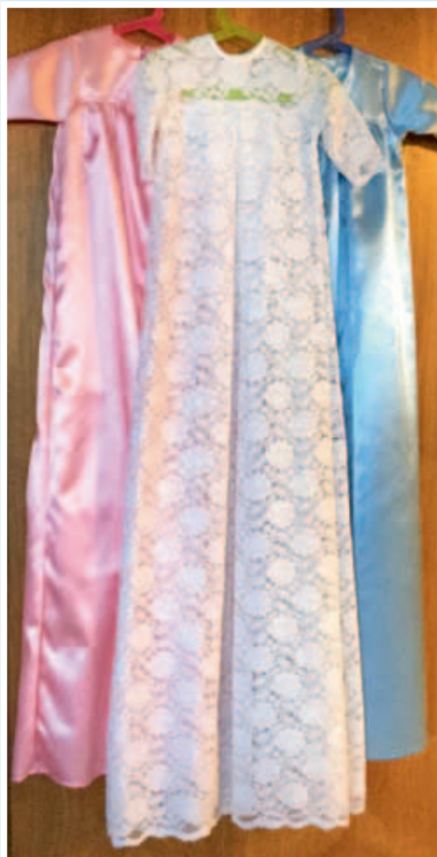
Det er denne fine dåbskjole, der nu kan lånes.

Hvis du mangler, og gerne vil låne, men du ønsker en anden type dåbstøj, så ring bare alligevel og lad os tage en snak, om det er muligt at opfylde jeres ønske.