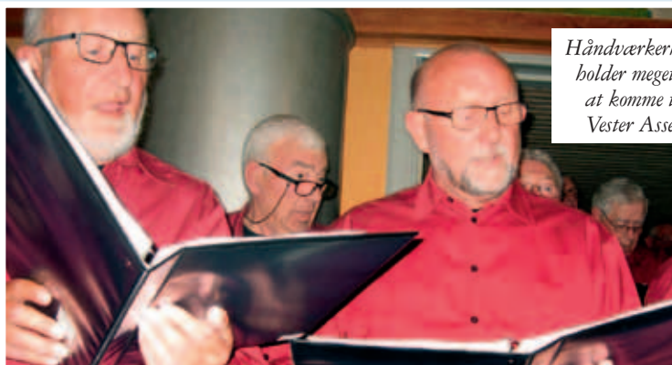
Håndværkerkoret holder meget af at komme til Vester Assels

Koret har efterhånden ladet røsterne klinge i Vester Assels nogle gange – og det gør de med stor fornøjelse, understreger de selv: »Hvis koret skulle have en fanclub, skulle den udgå fra Vester Assels. Her har vi haft nogle af de