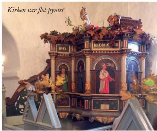
Kirken var flot pyntet

Undervejs lød jagthornet i kirken og understregede dermed temaet.