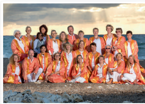
Klitmøller Gospelkor kommer til Øster Assels i februar.

Klitmøller Gospelkor i Øster Assels Kirke onsdag den 3. februar kl. 19.30