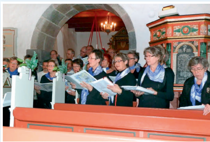
Nordmorskoret er med til at markere Hellig Tre Konger i Vester Assels.

Menighedsrådet byder på en forfriskning efter gudstjenesten i våbenhuset.